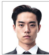
印刷での仕上がり

※画像の pixel (ピクセル) 数の確認方法 WINDOWS10 の場合 画像を選択して右クリックすると表示される メニュー最下部 「プロパティ」>「詳細」で画像のサイズ ●●●ピクセル × ●●●ピクセル が確認できます。