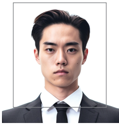
実際の写真と、使用する範囲 (幅 600pixel 高さ 650pixel 程度)